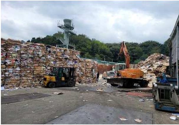
경기 용인시 압축상