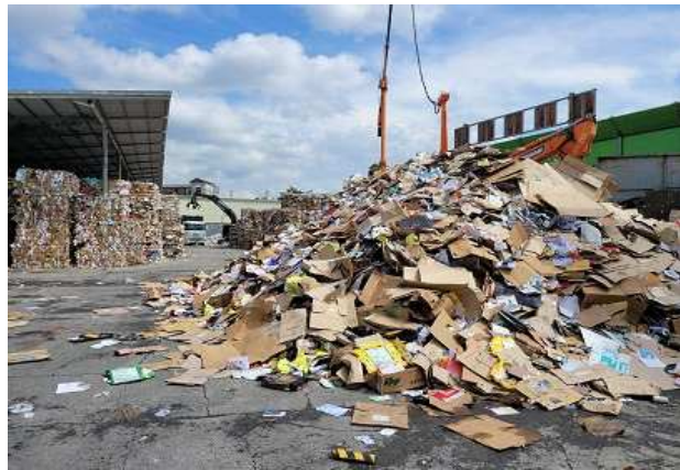
경기 남양주시 압축상