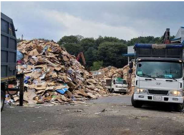
경기 용인시 압축상