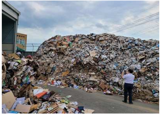
경기 용인시 압축상