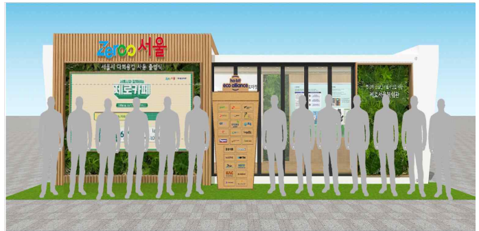
체험관 개관 세레모니