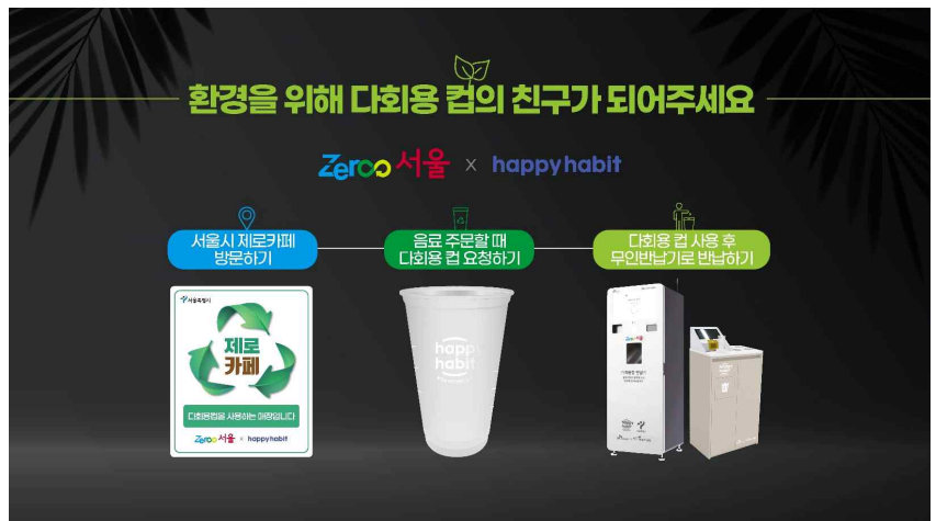
전광판 내 제로카페 모집 및 참여 카페 소개