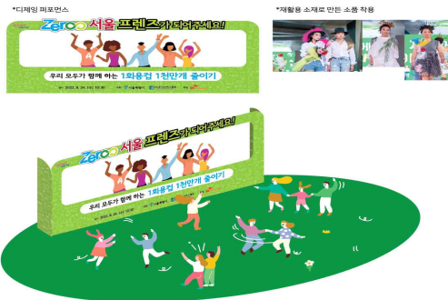
제로서울 프렌즈 제로댄스 플래시몹