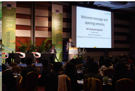
동반행사 (EU-에코이노베이션 포럼)