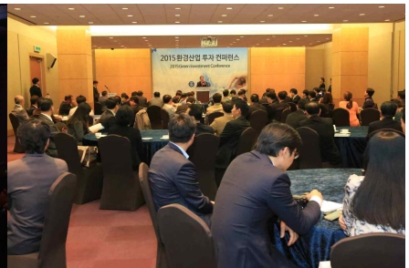
동반행사 (환경산업 투자컨퍼런스)