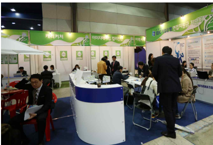
동반행사 (환경산업 일자리 박람회)