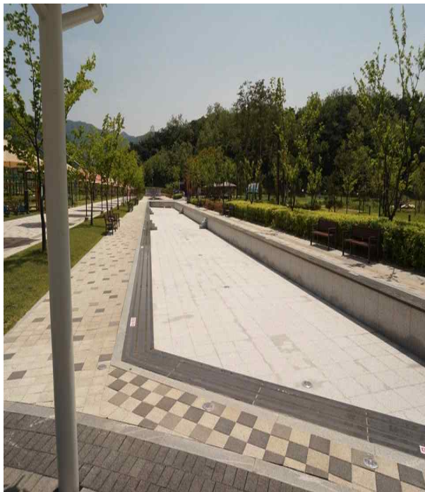
장터·체험·전시 부스 설치 장소